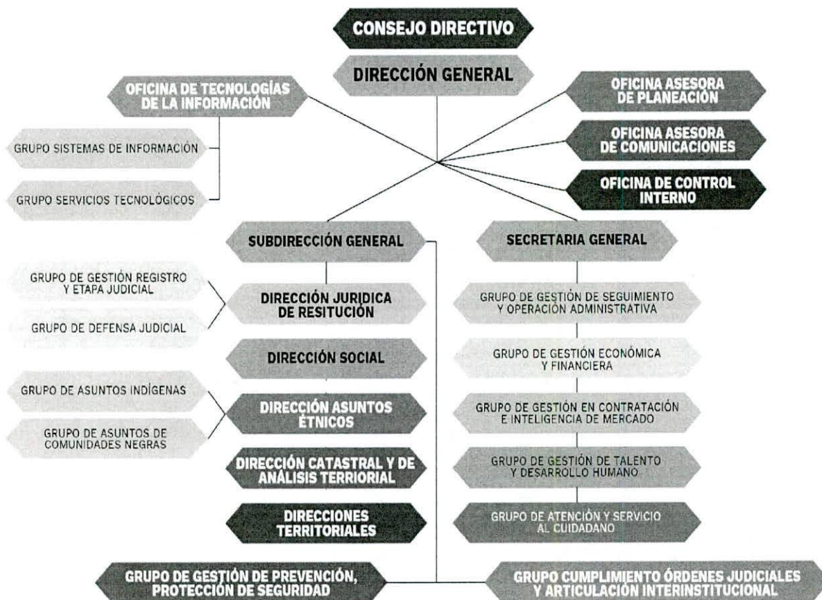
Elaboración: Oficina Asesora Comunicación- UAEGRTD

Que mediante el Decreto 4801 de 2011 se establece la estructura interna de la UAEGRTD, así: