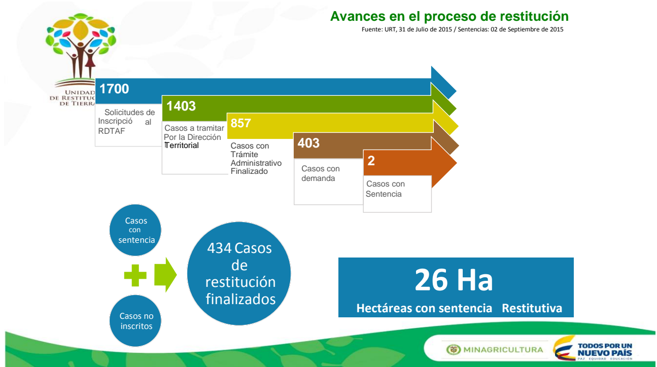
Cuadro resumen – Resultados etapa administrativa – Avances etapa judicial