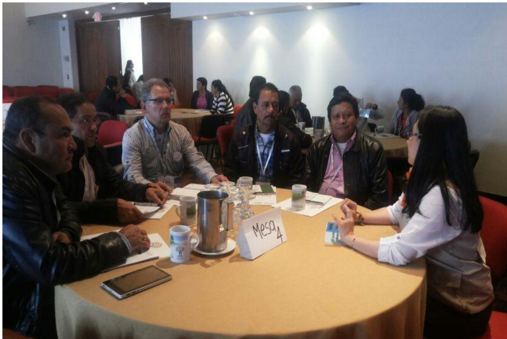
Fuente: Territorial Unidad de Restitución de Tierras Bogotá – Cundinamarca