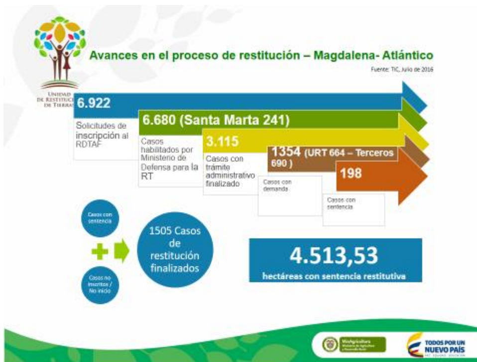
Cuadro resumen – Resultados etapa administrativa – Avances etapa judicial