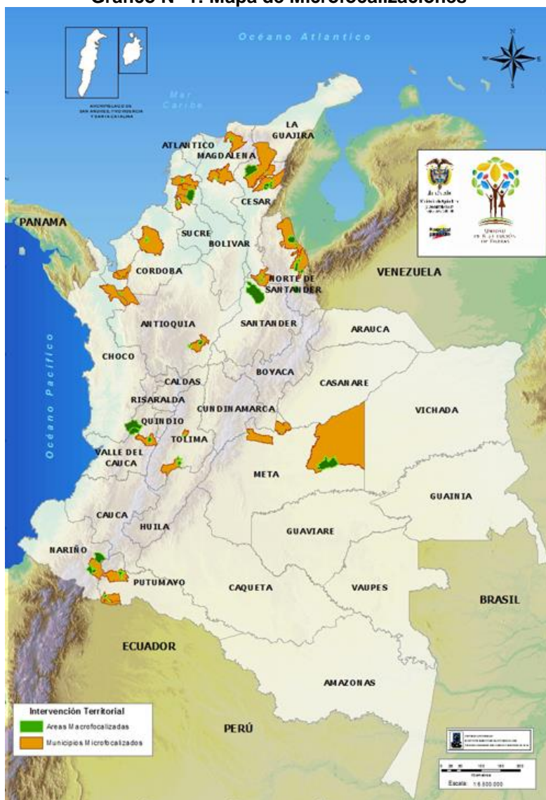
Gráfico N° 1: Mapa de Microfocalizaciones

Con el propósito de implementar el RTDA, atendiendo los principios de progresividad y gradualidad, se ha adelantado un proceso de macro 9 y microfocalización, el cual se define las áreas geográficas en las cuales se realizará el estudio de las solicitudes recibidas.