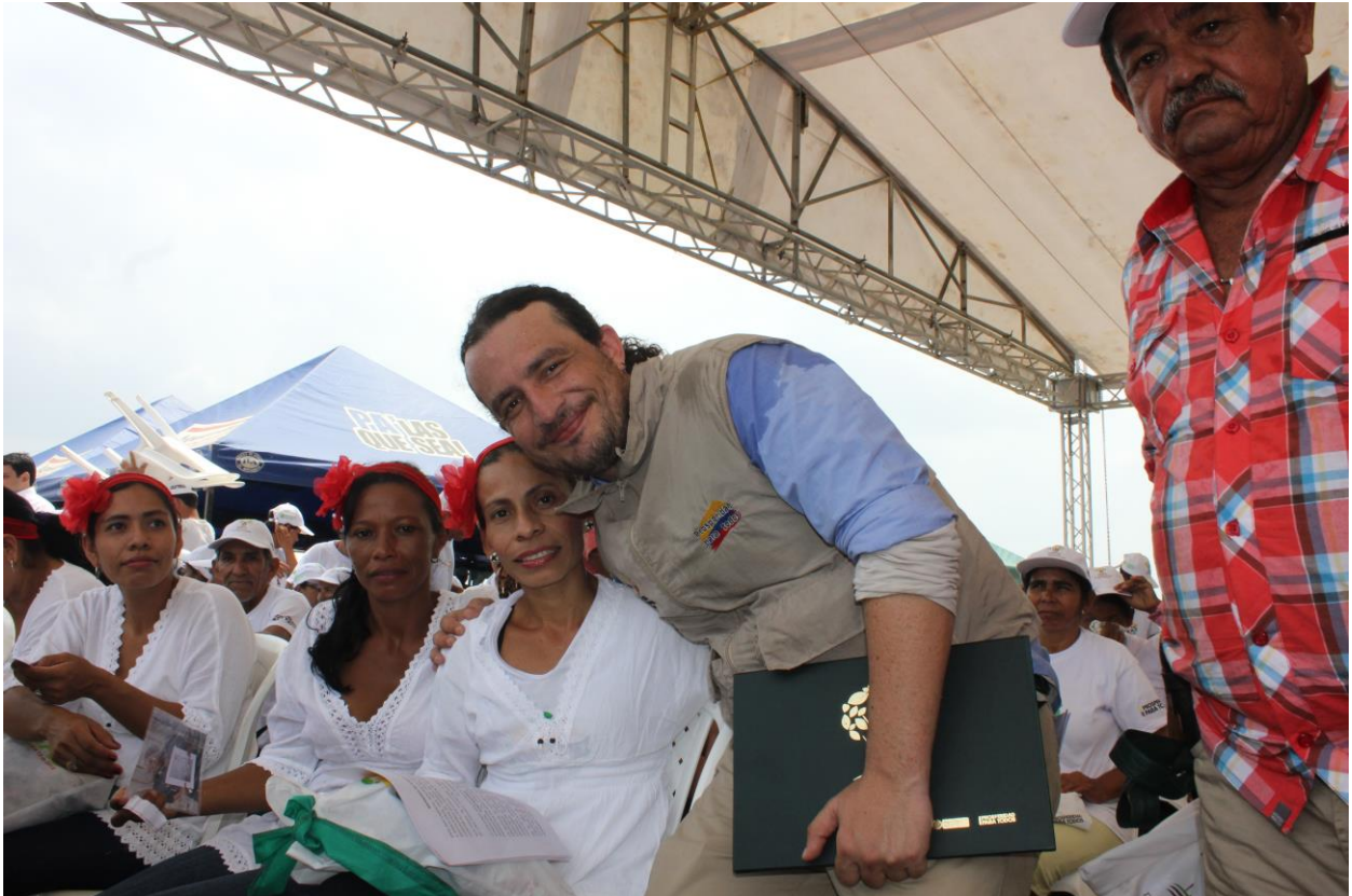
Oficina Asesora de comunicaciones - URT