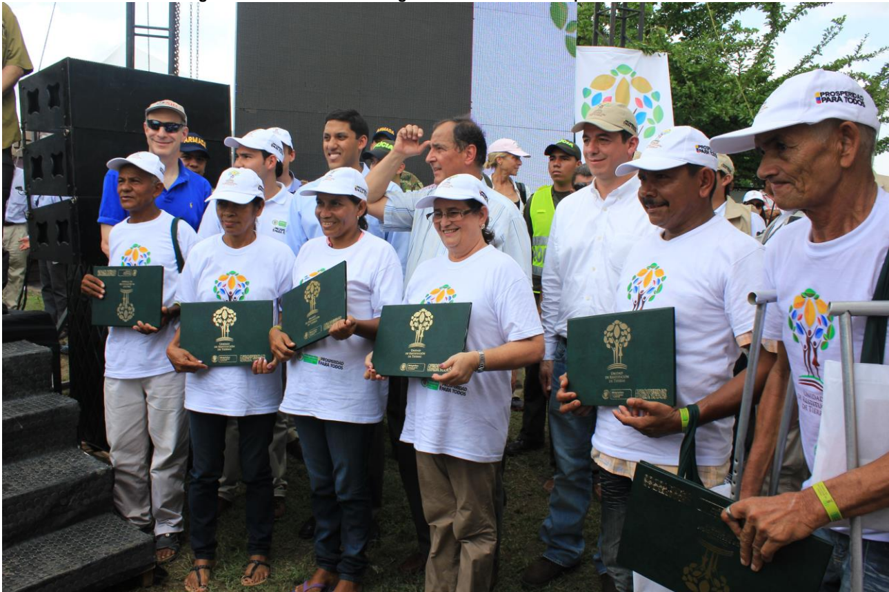
Fotografía No. 1: Evento de entrega de títulos en el municipio de Morroa - Sucre.