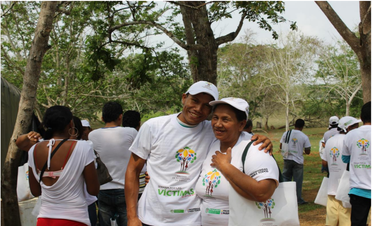
Fotografía No. 2: Evento de entrega de títulos en finca Santa Paula. Representantes de Familias restituidas.