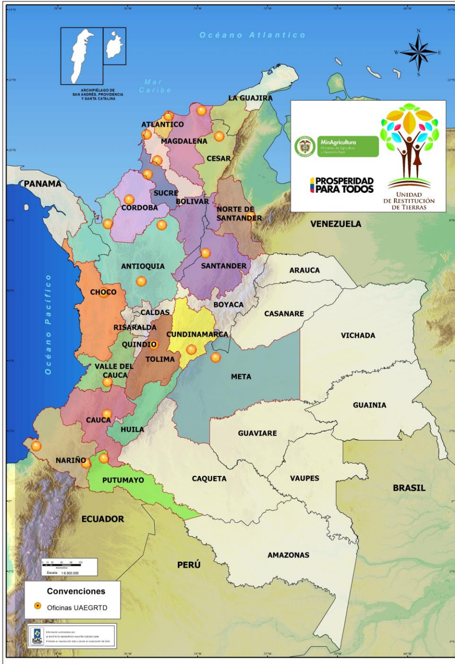
Gráfico No. 3: Mapa con las oficinas y direcciones territoriales