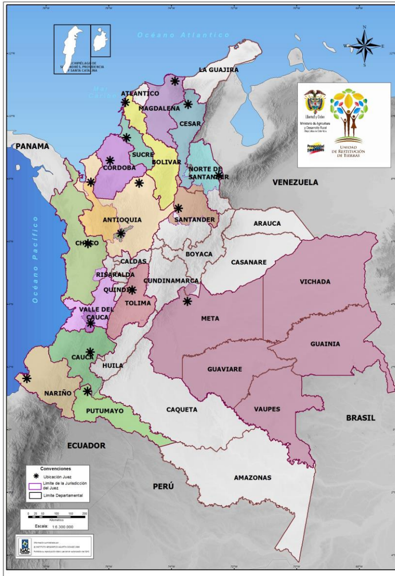
Gráfico No. 2: Ubicación de jueces a nivel nacional

El proceso de etapa judicial se caracteriza por el diseño de la estrategia probatoria y de defensa para solicitudes de restitución colectiva e individual; la elaboración y presentación de la solicitud de restitución según tipologías de despojo y/o abandono; la comunicación y la verificación en su integridad el sentido del fallo emitido de los fallos proferidos por los Jueces Civiles de Circuito o Magistrados especializados en Restitución de Tierras a la dirección general y a las entidades que haya lugar. Finalmente, de acuerdo con el análisis cualitativo del fallo, la verificación de la eficacia de las estrategias probatorias y de defensa y el impulso del proceso judicial.