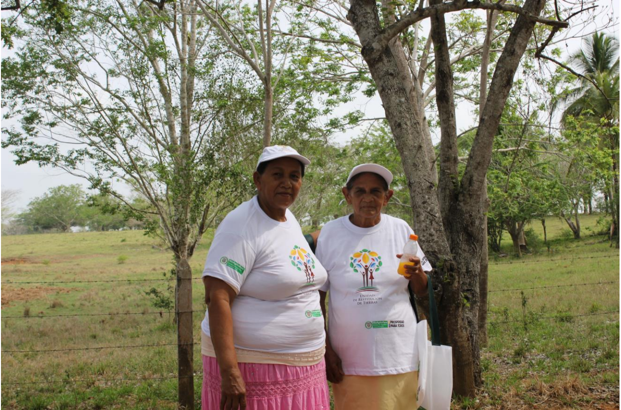
Fotografía No. 2: Evento de entrega de títulos en finca Santa Paula. Representantes de Familias restituidas.