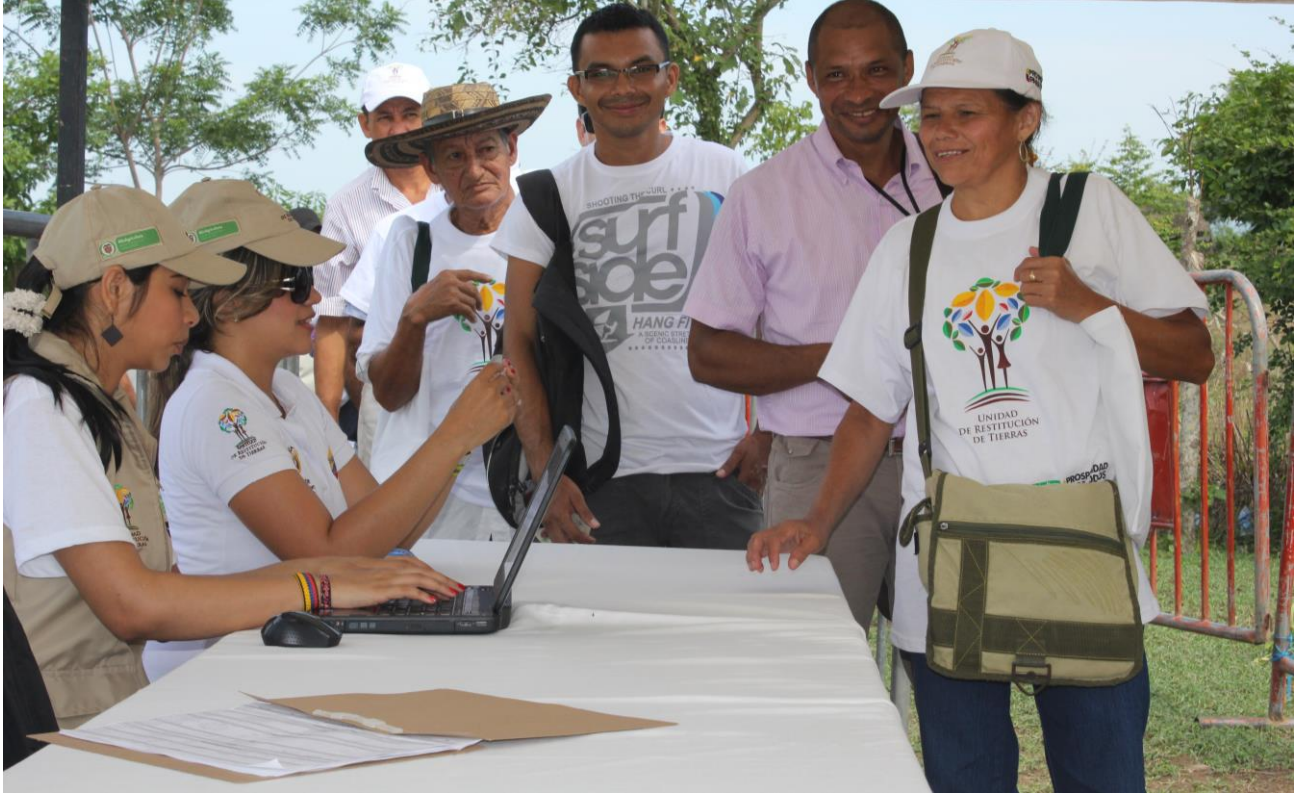
Fotografía No. 1: Evento de entrega de títulos en el municipio de Morroa - Sucre.