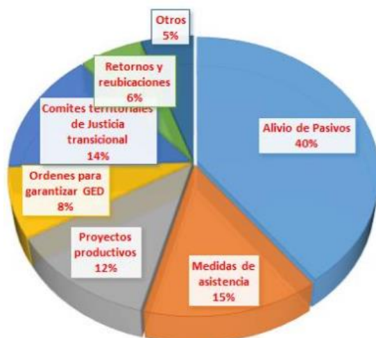
Gráfico 1 Órdenes dirigidas a Gobernación del Cesar y Alcaldías Municipales 6

Gráfica con corte a 30 de abril de 2016