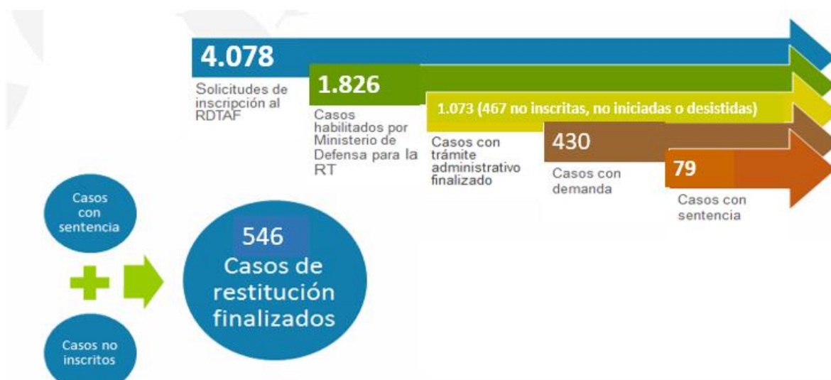
Gráfica 1. Resultados etapa administrativa – Avances etapa judicial. Departamento Norte de Santander.