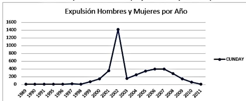
Gráfico 2: desplazamiento de hombre y mujeres del municipio de Cunday